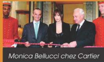
Monica Bellucci chez Cartier