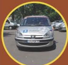
Peugeot voiture officielle