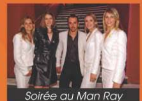
Soirée au Man Ray